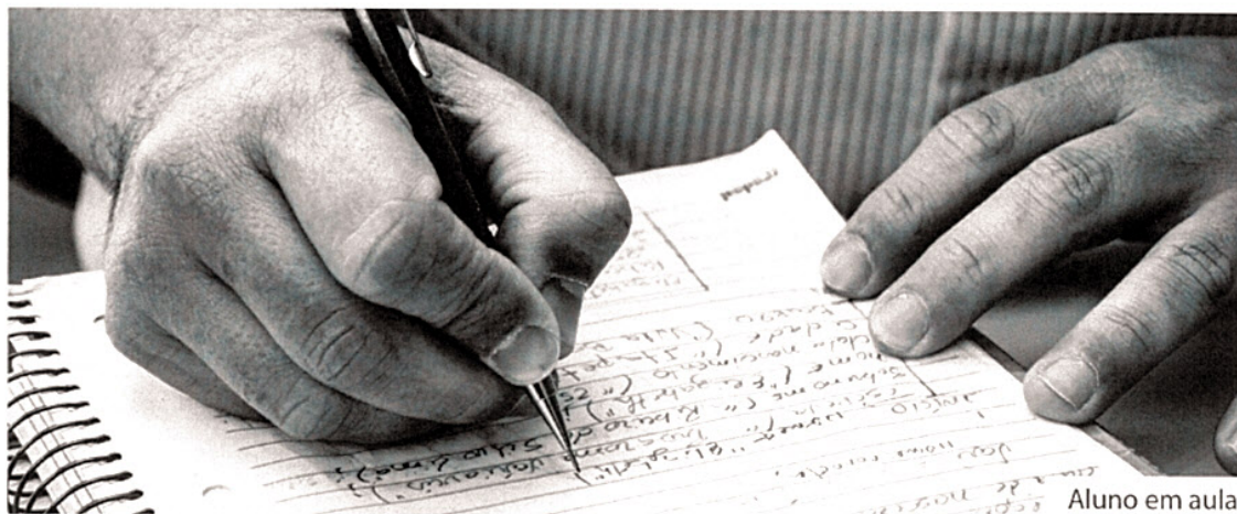
Aluno em aula