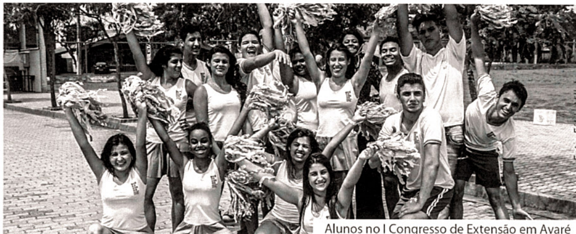
Alunos no I Congresso de Extensão em Avaré