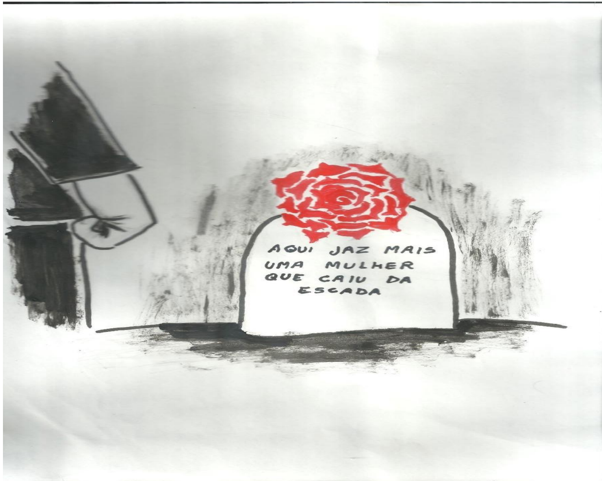
Ilustração: Stefany Araújo